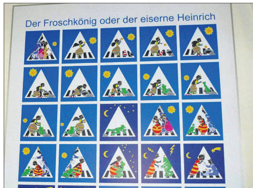
Froschkönig und Zebrastreifen: In der Grundschule am Königstor ist ein Kunstwerk von Doris Gutermuth zu sehen.

1992 eine Exzellenzmarke für innovative Schulentwicklung. Schüler sollen von der Europäischen Einigung begeistert werden und befähigt, sich in Europas Vielfalt und dem globalen Studien- und Arbeitsmarkt zurechtzufinden. An Europaschulen gibt es ein großes Sprachenangebot, das durch den Einsatz des europäischen Portfolios unterstützt wird. (chr)